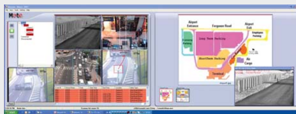
Behavir Watch™, Cortex Viewer™ / Server™, iSense™ sont des marques de commerce de MATE Ltd.

L'API de Cortex est un composant DLL de Microsoft .Net faisant l'interface entre un client (tel que Cortex Viewer™) et Cortex Server™ ainsi que les périphériques vidéo de MATE. Le API permet à l'OEM de développer son analyse vidéo et son réseau de transmission autour des périphériques MATE. L'API Cortex propose une interface fixe et autonome pour le mappage des périphériques vidéo à l'attention d'un client donné et la définition des règles d'analytique vidéo pour ces périphériques, l'affichage vidéo et le traitement de l'événement. L'API prend en charge l'accès aux descriptions de texte et aux instantanés ainsi qu'à la vidéo de pré et post alarme pour l'analyse des événements. L'API Cortex tient lieu de base pour des communications multiples et contrôle des applications telles que les courriers électroniques, les serveurs OPC, etc.